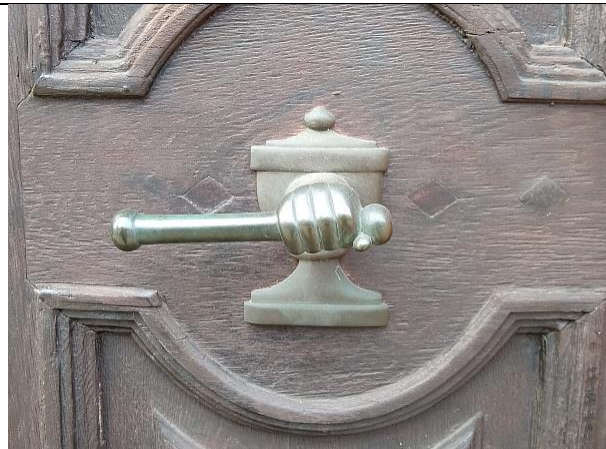
B = Anzahl der Klinken an der gesamten Tür