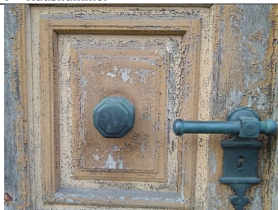
H = Hausnummer