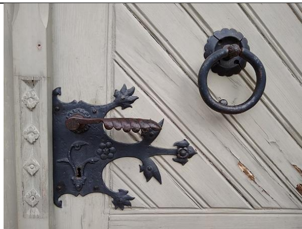
K = Anzahl der Ringe an der Tür wie im Bild